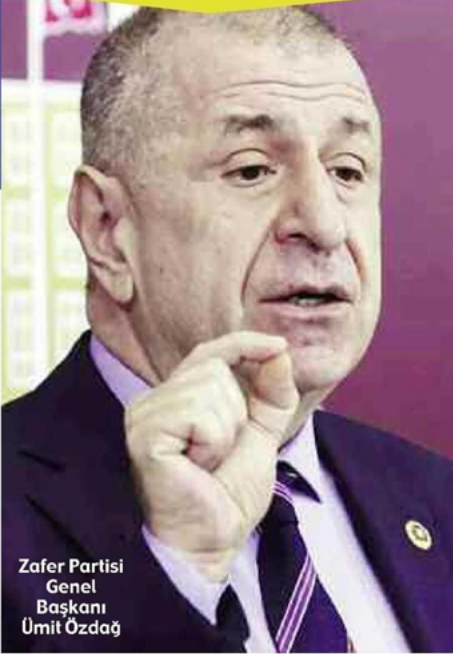
Zafer Partisi Genel Başkanı Ümit Özdağ

ZAFER PARTİSİ LİDERİ ÖZDAĞ'DAN ŞOK İDDİA!