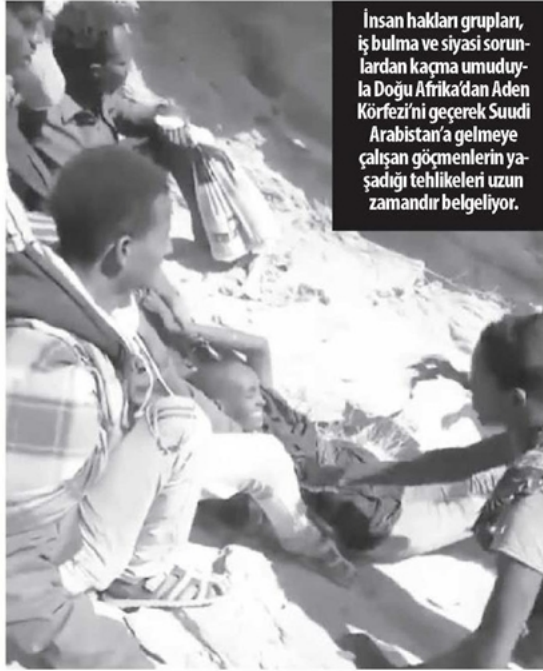
İnsan hakları grupları, iş bulma ve siyasi sorunlardan kaçma umuduyla Doğu Afrika'dan Aden Körfezi'ni geçerek Suudi Arabistan'a gelmeye çalışan göçmenlerin yaşadığı tehlikeleri uzun zamandır belgeliyor.

BM yetkililerinin daha geçen Aralık ayında bilgilendirmesine rağmen Suudi Arabistan sınır güçlerinin Yemenli göçmenleri katletmesine ABD'nin aylardır göz yumduğu iddia edildi. BM'nin geçen hafta yayınladığı Üzerimize Kurşun Yağdırdılar başlıklı yeni raporunda Suudi Arabistan'ın sınır muhafızları Yemen sınırındaki göçmenleri topluca öldürmekle suçlanıyor.