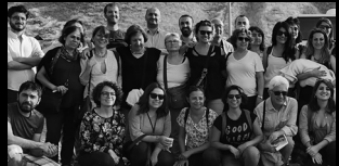
TÜRKİYE İNSAN HAKLARI VAKFI HUMAN RIGHTS FOUNDATION OF TURKEY