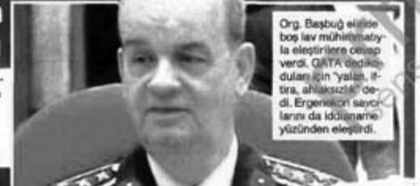
Org. Basbuğ elinde bir silahla eleştirilere cevap veriyor. GATA'da düzenlenen yalın, itira, ahkâsız" dedi. Ergenekon suçlarının da iddianame yüzünden eleştirildi.

Ergenekon'dan yargıya, medyadan darbeye, terörden bedelli askerliğe kadar çok önemli çıkışlarda bulundu