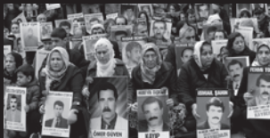
CUMARTESİ ANNELERİ / İNSANLARI SATURDAY MOTHERS / PEOPLE