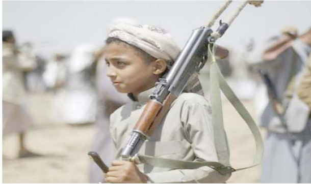
Ortadoğu, 14 Haziran 2018

Husilerin, 2 bin 372 okulu kısmen ya da tamamen yıktığını, bin 500'ü aşkın eğitim kurumunun da cezaevi ya da askeri kışla olarak kullandığını kaydeden Kemal, 4,5 milyondan fazla çocuğun ise okula gidemediğini ifade etti. Uzun süredir siyasi istikrarızlığın hüküm sürdüğü Yemen'de, Husiler ile meşru yönetime bağlı güçler arasında çatışmalar yaşanıyor. Husiler, Eylül 2014'ten bu yana başkent Sana ve bazı bölgelerin denetimini elinde bulundururken Suudi Arabistan öncülüğündeki koalisyon güçleri ise Mart 2015'ten beri Husilere karşı Yemen hükümetine destek veriyor. (A.A.)