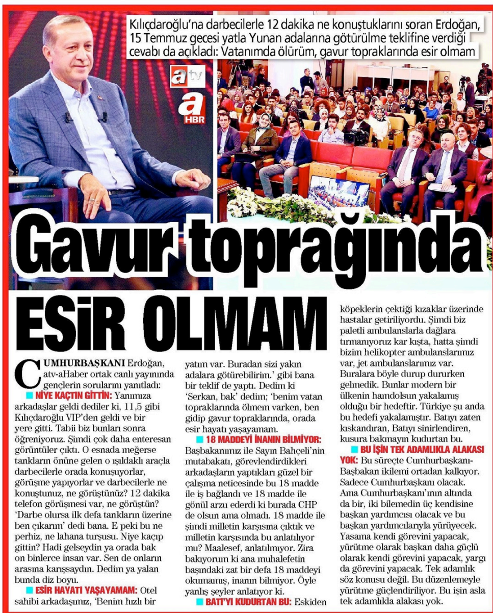
Figure 11: Takvim, 4 March 2017

President Erdoğan's statement "I rather die in my country than to live in captivity in the lands of the giaour" are used in titles in some newspaper without quotation marks and with large fonts in an affirming way. As can be seen in this statement, the giaour discourse, which is loaded with intertwined meanings like 'non-Muslim', 'enemy', 'traitor' and 'cruel' in social memory, became a propaganda tool during pre-referendum period.