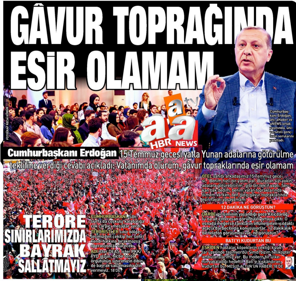
Şekil 10: Sabah, 4 Mart 2017

Bunun yanı sıra, 15 Temmuz darbe girişiminin ardından Yunanistan’a sığınan askerlerin iadesi üzerine iki ülke yaşanan anlaşmazlıklar ve Cumhurbaşkanı Erdoğan’ın referandum konuşmalarında darbe girişimi gecesi yaşadıklarına dair yorumları, yazılı basının gündem maddelerindendi.