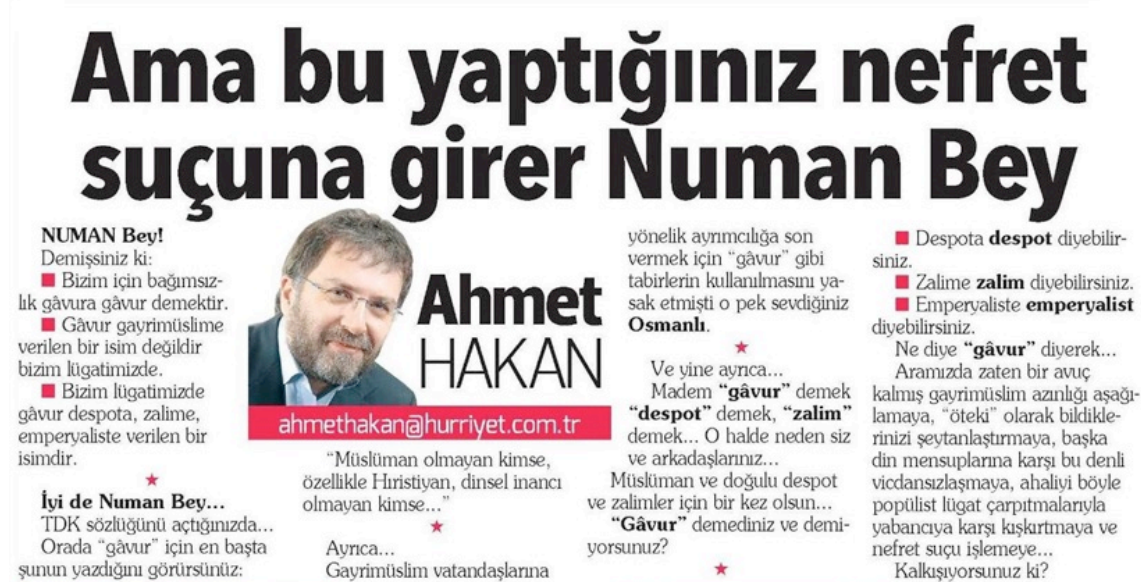
Şekil 13: Hürriyet, Ahmet Hakan, 5 Aralık 2016

İncelenen dönemde, gâvur kelimesinin kullanımına yönelik eleştirel bir söylem geliştirilen haber ve köşe yazılarında, söylemin kullanımı, temelde iki gündem maddesi üzerinden tartışıldı: 2 Aralık 2016'da Numan Kurtulmuş'un Kastamonu'da bir toplantıda yaptığı açıklama ve 16 Nisan 2017 anayasa değişikliği referandumu öncesi toplumu kutuplaştıran söylemler.